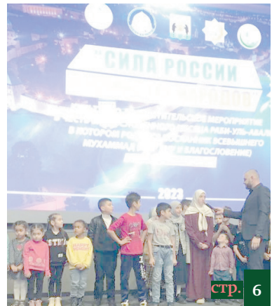
МАВЛИД АН-НАБИ В РЕГИОНАХ СТРАНЫ