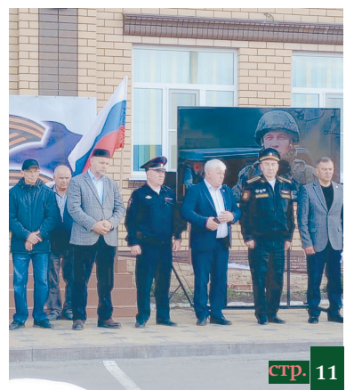
ПОДДЕРЖКА УЧАСТНИКАМ СВО