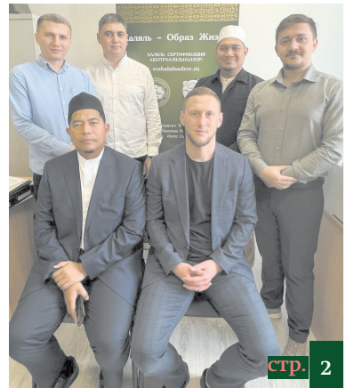
«ЦЕНТРАЛЬНЫЙ ДЗОР» - МАЛАЙЗИЯ

все – что происходит не только сейчас, а на протяжении десятилетий – как проявление несправедливости, возведенной в какую-то невероятную степень. Почему? Потому что изначально, когда принималось решение о создании государства Израиль, было принято одновременно, параллельно и решение о создании второго государства», – сказал российский лидер.